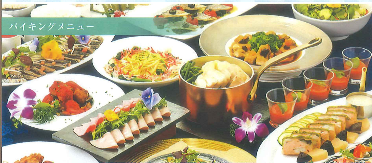
バイキングメニュー